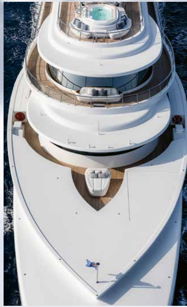
Excellence, "American Eagle (Amerikan Kartalı)" stili ters pruvası ile dikkat çekiyor.

Cayman Adaları bayrağını taşıyan dev bir yat, ait olduğu mavi dünyaya kavuştu artık. Adı Excellence (Mükemmellik) ve isminin anlamına yararış özellikler taşıyor. Tecrübeli bir denizci olan sahibi, hayal ettiği gibi bir yata kavuşmadan önce beş tekneyle seyrederek adeta Excellence'a hazırlanmış, provasını yapmış. Sonra Excellence'ın büyük kız kardeşini gördüğünde aradığını bulduğunu anlamış. Yatın adının bizdeki karşılıkları arasında "seçkinlik", "üstünlük" de yer alıyor. Hepsi de Excellence'ın tasarım felsefesinin temelini oluşturan kavramlar.