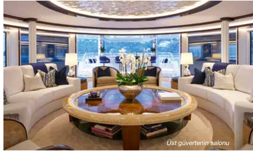
Üst güvertenin salonu