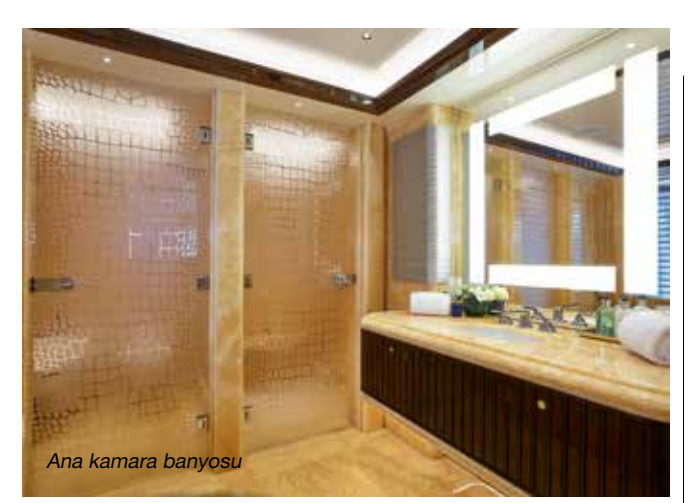
Ana kamara banyosu